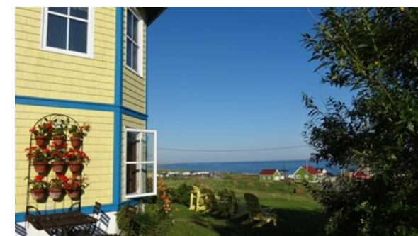
Terrasse privée de l'appartement

L'appartement dispose de 2 chambres à coucher, une grande salle de bain complète, une cuisine toute équipée et un séjour attenant à la terrasse privée côté mer