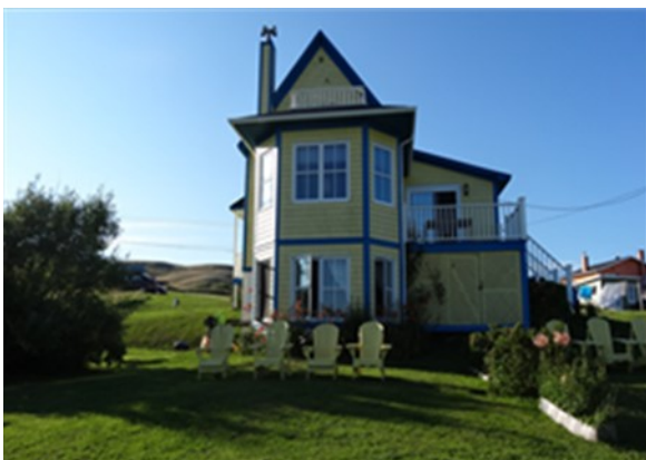
Maison côté sud

La maison dispose de 4 chambres à coucher, une salle d'eau à l'étage, une salle de bain complète au rez-de-chaussée, deux grandes salles de séjour, une salle à dîner avec vue sur mer, une grande cuisine et une terrasse privée attenante à la cuisine côté mer